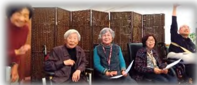
水曜クラブ 「コーラス」 練習の成果を発揮