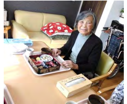
職員手作りのおせち料理