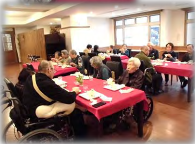
サ高住との合同クリスマス会