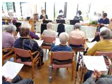
クリスマス会 ～カリンバ演奏～