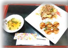
焼きそば・たこ焼きランチ