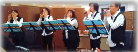
オカリナ演奏 「レインボー」 綺麗な音色をありがとうございました